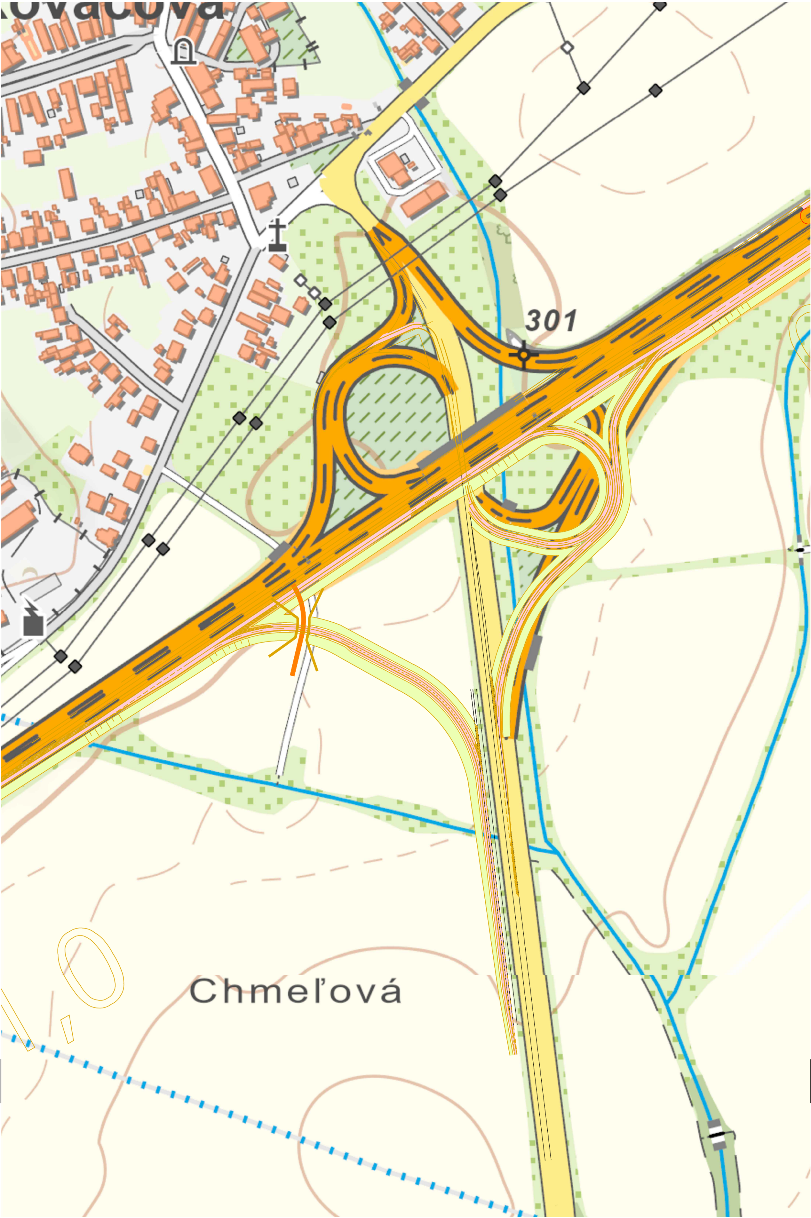
KRIŽOVATKA KOVÁČOVÁ km -0,255