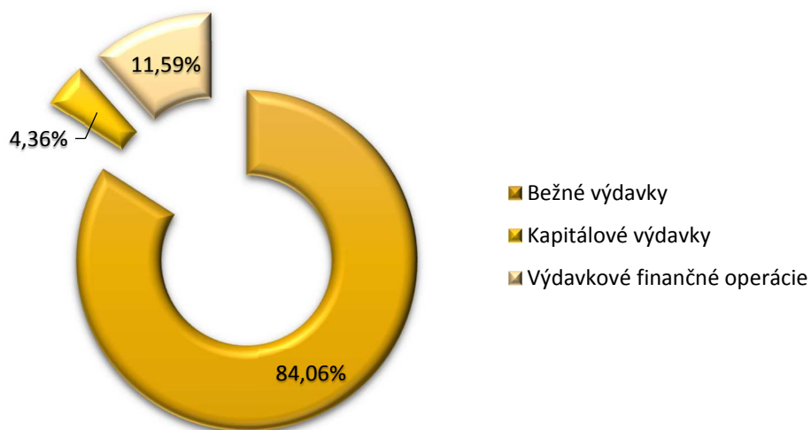
Graf 2: Celkové výdavky