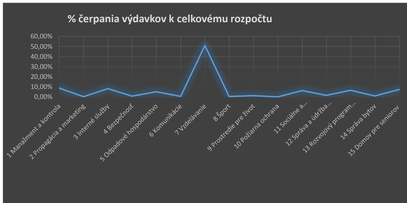
Graf 3: % čerpania výdavkov k celkovému rozpočtu