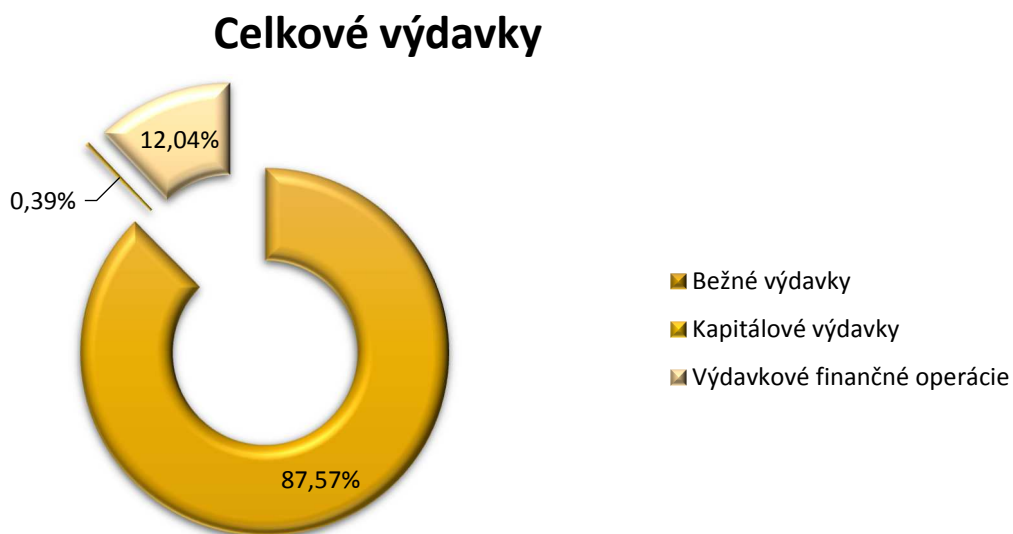
Graf 2: Celkové výdavky