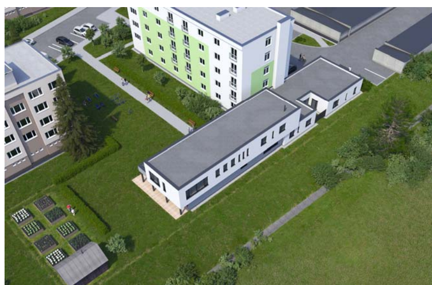
POHĽADY Z VTÁČEJ PERSPEKTÍVY – VIZUALIZÁCIA