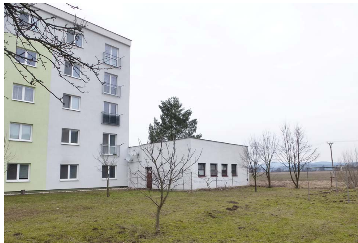
FOTODOKUMENTÁCIA EXISTUJÚCEHO STAVU OBJEKTU BÝVALÁ PLYNOVÁ KOTOLŇA - 04/2018