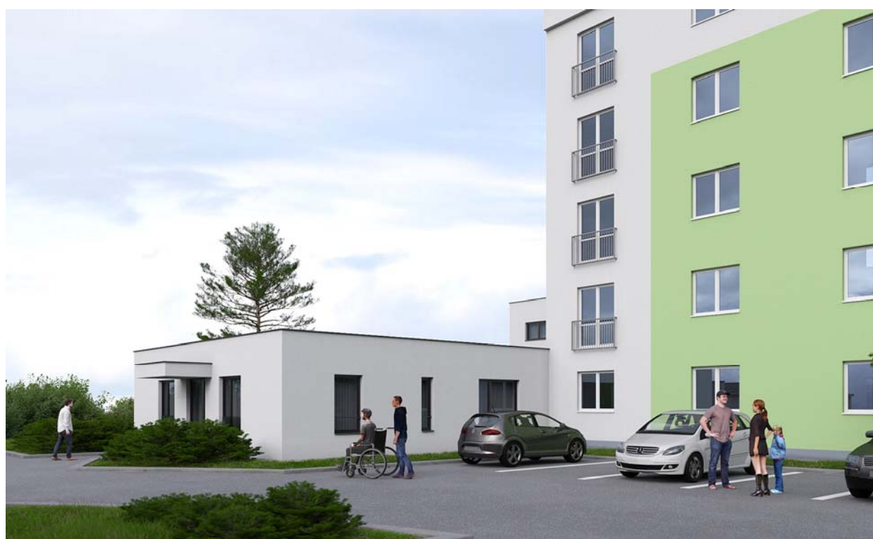
POHLÁDY – VIZUALIZÁCIA